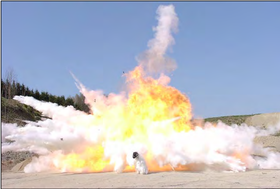
Mehlbombe auf dem Übungsgelände der Pyrotechnikerschule