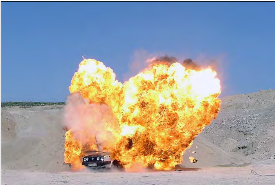
Prüfungsaufgabe: Autoexplosion mit Sprengschnur, Shotgun und Benzin

596 Seiten / 242 Abbildungen ISBN 978-3-931360-22-1