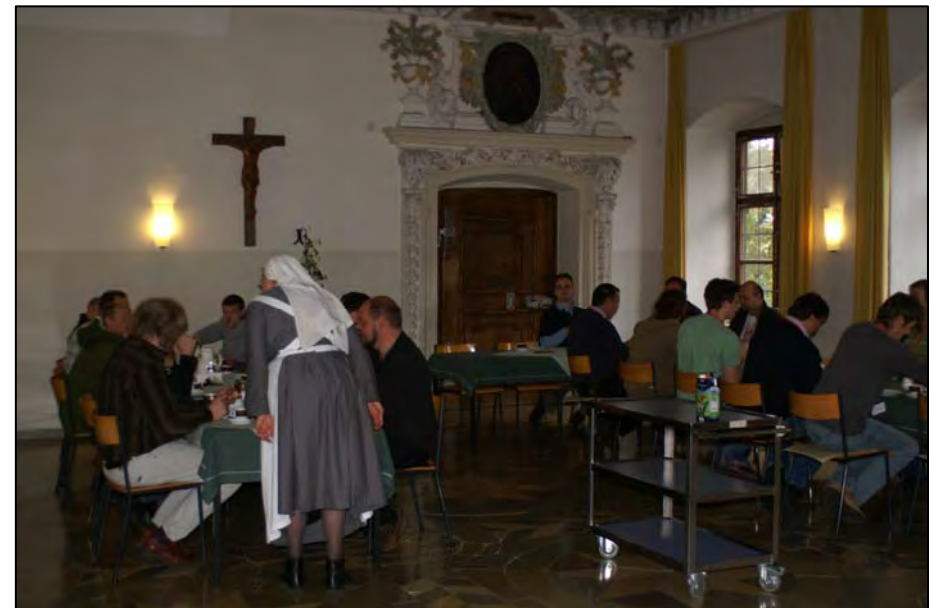
Speisesaal für Mittag, Kaffeetrinken und Abendbrot