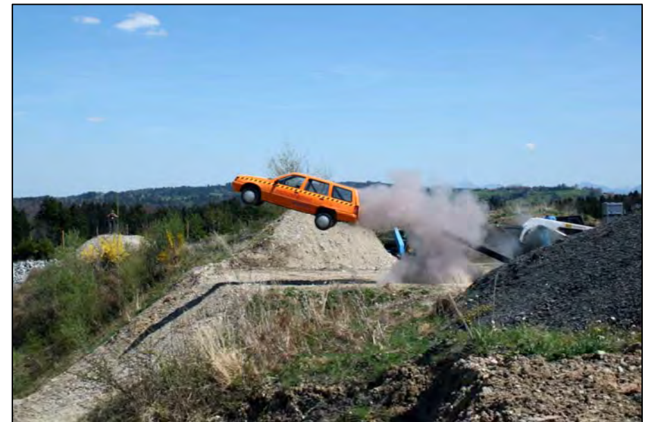
Kanonenauto; wird mit 1.500 Gramm Schwarzpulver durch die Luft geschossen