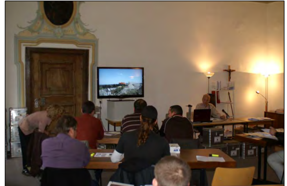
Unterrichtsraum für den theoretischen Unterricht mit vielen Bildbeispielen am LCD Bildschirm