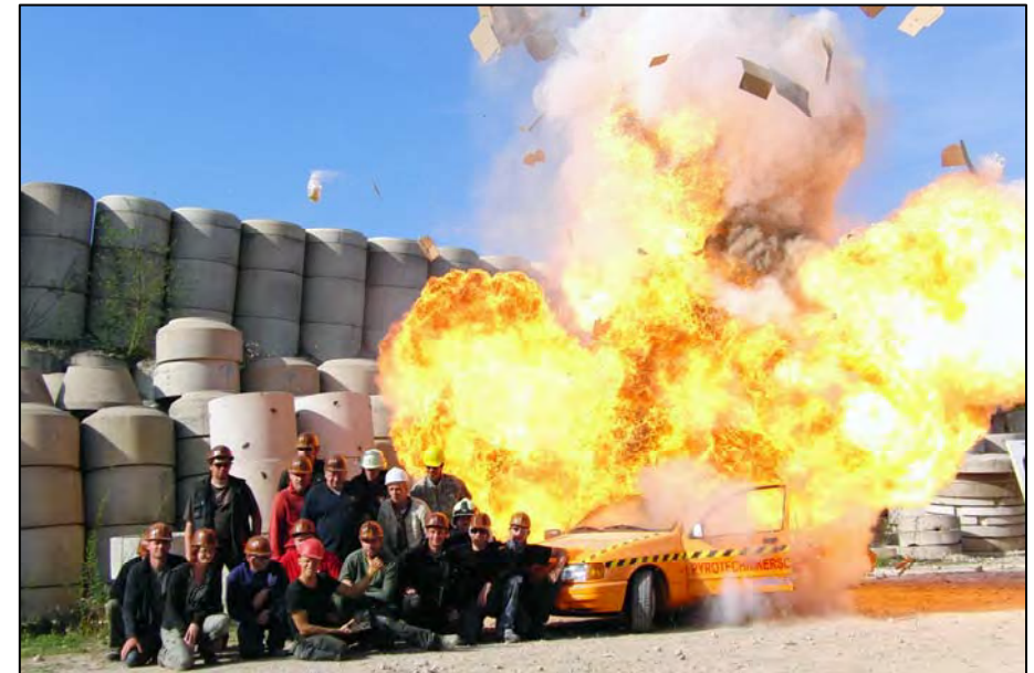
Prüfungsaufgabe: Autoexplosion mit Darstellern in unmittelbarer Nähe

Hummig in Peißenberg (ganztägig) .....08803 6369-0 Hummig im Kloster .....0176 24633867 Taxi Peißenberg (Etzel) .....08803 2480 Taxi Peißenberg (Guggemoos).....08803 60505 Taxi Weilheim (Schambeck).....0881 8950 Taxi Weilheim (Bosch) .....0881 3444 Taxi Weilheim (Stocchi) .....0881 3682